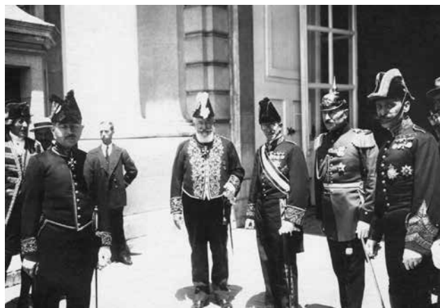
Miembros de la legación de Chile en Madrid

El mismo autor describe que posterior a esta adquisición se procedió a la compra del material aeronáutico antes mencionado, contando con parte del dinero que inicialmente se había destinado a la compra de pólvora.