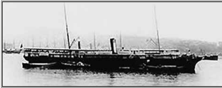
Transporte Rímac lanzado al mar en 1874

El propio comandante Bulnes concurrió a la Comandancia General de Marina y se contactó con el intendente de Valparaíso don Eulogio Altamirano, quien le contestó que tendrían que esperar órdenes del presidente de la república y noticias más certeras del accionar de la escuadra enemiga. En estos dos largos días de espera e incertidumbre, el historiador don Gonzalo Bulnes Pinto, hermano menor del comandante y segundo comandante, quién los acompañaba desde su viaje de Santiago en tren, fue testigo de la inquietud y desazón de sus hermanos mayores por no poder partir lo antes posible al norte para defender los intereses de Chile. 5