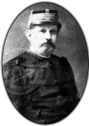
Manuel Bulnes Pinto comandante del Escuadrón

El 17 de julio de 1879, salía el recientemente creado Escuadrón de Carabineros de Yungay al mando de su comandante don Manuel Bulnes Pinto, con una fuerza de 240 jinetes de su cuartel de circunstancia ubicado en la capital, en la Alameda de las Delicias con calle Santa Rosa, un imponente y antiguo edificio que posteriormente fue Escuela Técnica Superior Femenina y también Cuartel de la Escuela Militar de Chile.