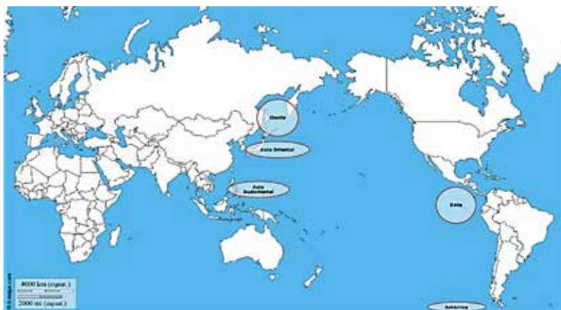
Cuadro N° 1: Mapa de la Cuenca del Pacífico y sus regiones

*Fuente: "Mundo centrado en Océano Pacífico: costas, hidrografía". d-maps.com. Disponible en: d-maps.com/carte.php?num_car=3228&lang=es La identificación de las regiones es de elaboración propia.