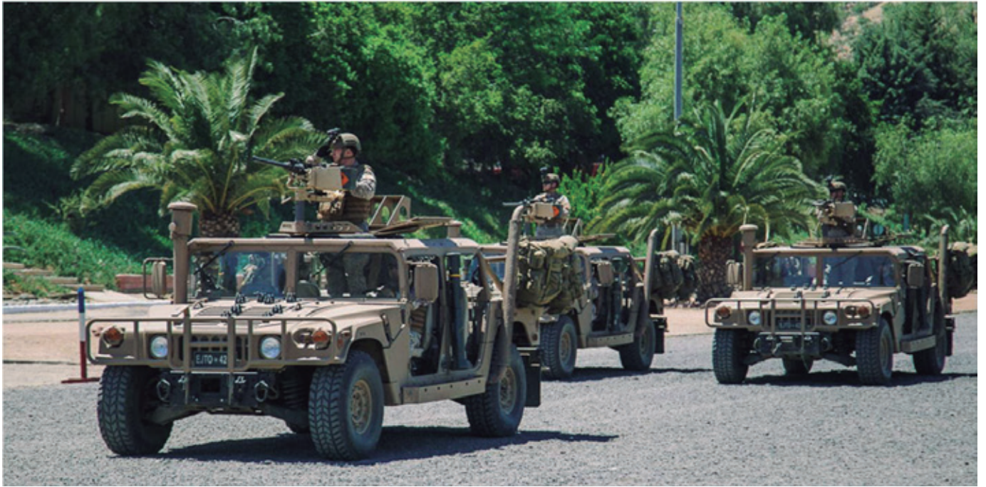
El año 2007 esta unidad agrupa todas las compañías de comandos y fuerzas especiales, reuniéndolas en la comuna de Colina, con el nombre de Brigada de Operaciones Especiales (BOE) "Lautaro".

el entrenamiento, la experiencia y los conocimientos técnicos y tácticos son fundamentales para crecer en el ámbito profesional.