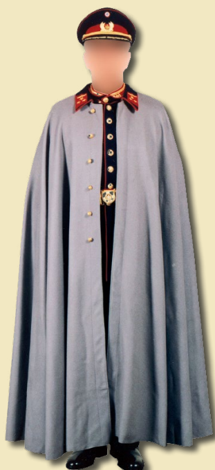
Oficial jefe en tenida con capa.

En el periodo comprendido entre 1985-1990 estuvo vigente el "Reglamento de vestuario y equipo del Ejército" del año 1982. Sin embargo, a este reglamento se le fueron introduciendo paulatinamente modificaciones y nuevas incorporaciones mediante órdenes comando y publicaciones a través del Boletín Oficial del Ejército.