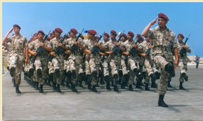
Tenida de mimetismo zona norte. Regimiento Exploradores, 1987.

Con fecha 27 de diciembre de 1989 se ordenó el uso de la espada de gala para oficiales masculinos y la daga para oficiales femeninos de la Institución, ambas con la firma de O'Higgins en la hoja. Se estableció una daga y/o espada de gala para generales y una espada de gala para oficiales. De forma simultánea, se derogó el uso del sable Cabeza de León para los oficiales masculinos de la Institución, quedando este modelo en uso para los escoltas de estandarte de combate y para algunos alumnos de la Escuela Militar. DCHEE