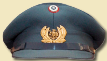
Gorra de salida de Cuadro Permanente.