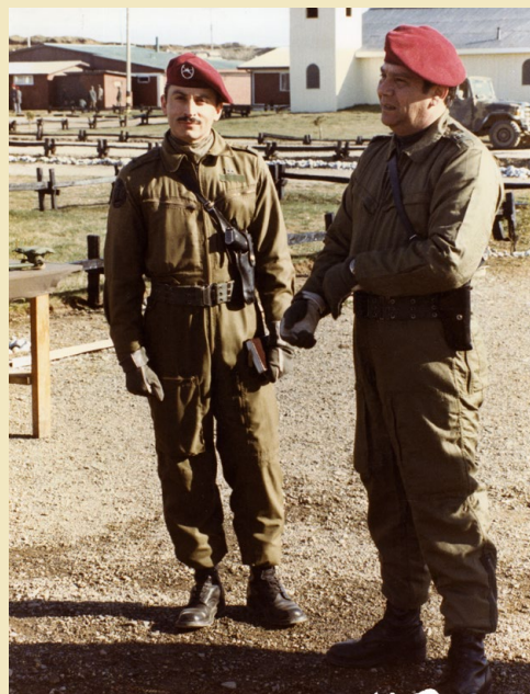
Oficiales con buzo tanquista modelo israelí. Regimiento Dragones, 1986.

El 16 de abril de 1985 se autorizaron descuentos en mensualidades para la adquisición de determinados artículos que componen el uniforme militar, decisión justificada por la necesidad de que los oficiales en comisiones extrainstitucionales o que desempeñaban funciones en altas reparticiones tuvieran las tenidas suficientes para representar dignamente a la Institución. Se agregó al uniforme de etiqueta la capa, debido a que antes solo se podía adquirir esta prenda fuera de la cuota de vestuario anual.