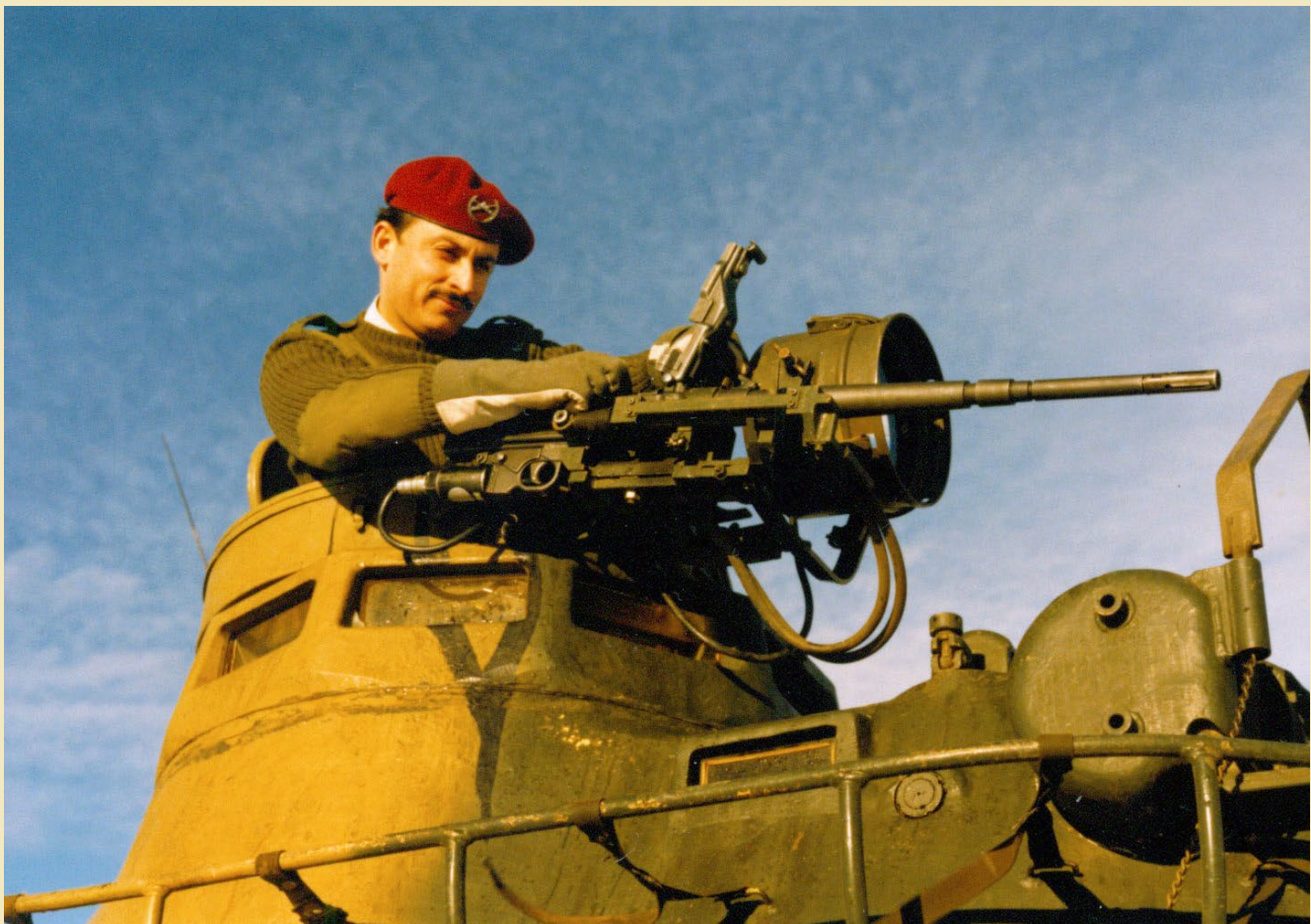
Oficial con suéter de lana verde, 1987.