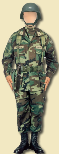
Tenida de combate Rip-stop, zona sur.