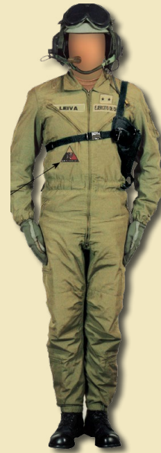
Tenida de buzo de tanquista.

El 21 de octubre de 1985 se autorizó en el vestuario en uso del Ejército el suéter “modelo inglés” en su versión nacional para actividades de servicio, instrucción, combate y oficina. Para ese año ya se usaba el suéter modelo inglés, versión británica de mimetismo en la zona austral, pero era de uso particular, no reglamentado y, además, tenía cuello en V. Se dispuso que el modelo a usar por la Institución sería el suéter cuello redondo, en color verde oliva para las zonas central y sur. Por su parte, las unidades de fuerzas especiales debían utilizar un suéter de color negro, al que se le agregó el uso de la sobaquera a partir de 1987, accesorio que ya era utilizado por los tanquistas desde 1981. A objeto de aclarar algunos detalles relacionados con el uso de dicha prenda de vestuario, se dejó claramente establecido que la autorización del uso del suéter era de carácter experimental y por un plazo de tres años, siendo exclusivo para personal de oficiales y cuadro permanente, mientras que el con-