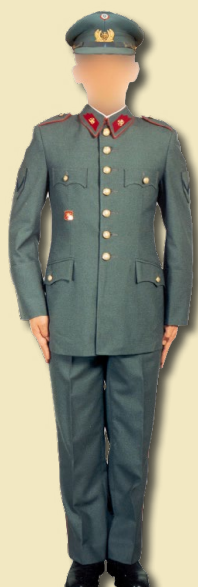
Tenida de salida de Cuadro Permanente.

tingente debía continuar usando el cargo de chalecos y jerseys en existencia.